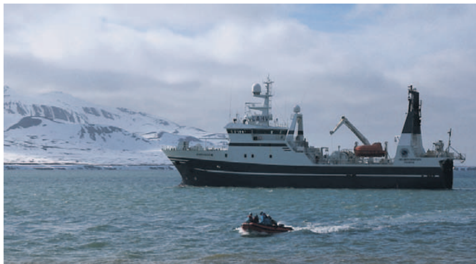
På tokt: Forskningsskipet Helmer Hanssen på tokt utenfor Svalbard.