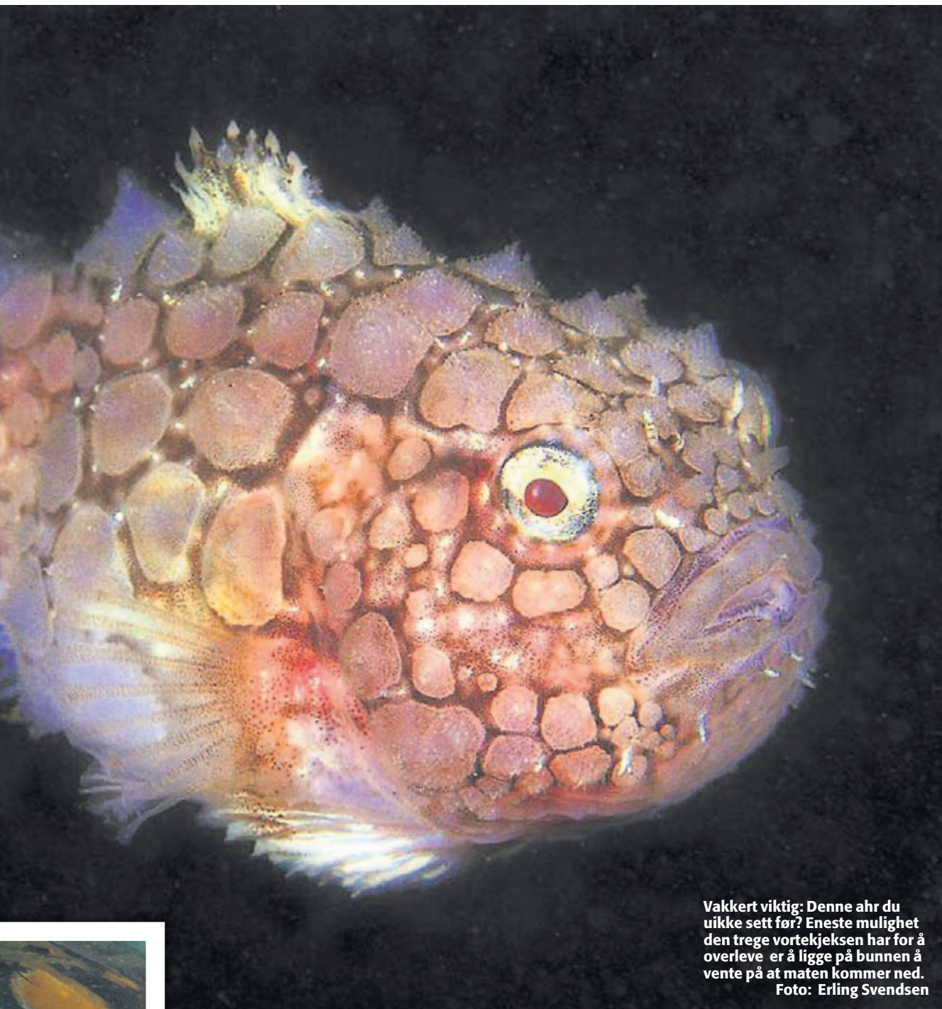
Vakkert viktig: Denne ahr du uikke sett før? Eneste mulighet den trege vortekjeksen har for å overleve er å ligge på bunnen å vente på at maten kommer ned.