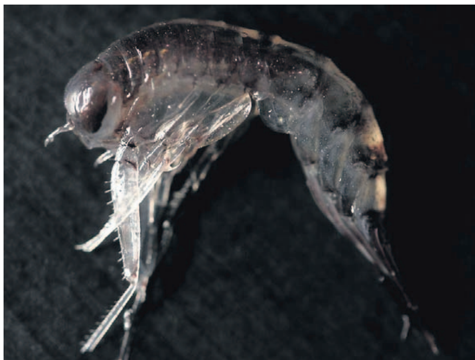
Til venstre en sverm svartåte under drivisen nord for Svalbard, til høyre en forstørret svartåte.