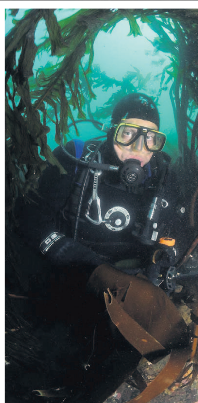
Dyppdykk: Forsker i tareskogen utenfor Svalbard. Arkivfoto fra 2008 av GUNIS).