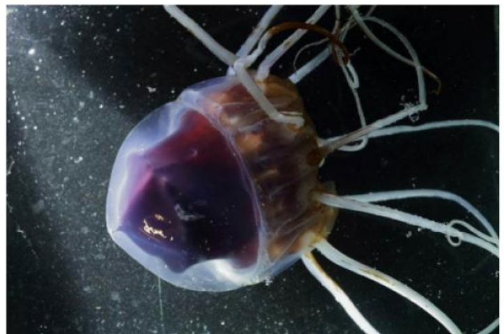
OPPDAGELSE: Dypvannsmaneten Periphylla, på norsk kronemanet, er for første gang observert på Svalbard.

I Asia er denne typen manet ettertraktet som eksklusiv festmat. Den skal også inneholde jod, jern